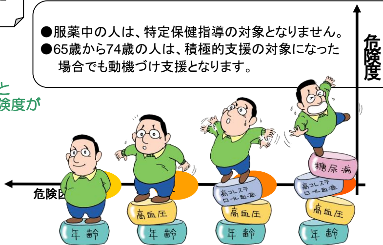
情報提供から動機付け支援、積極的支援の一連の流れのイメージ図